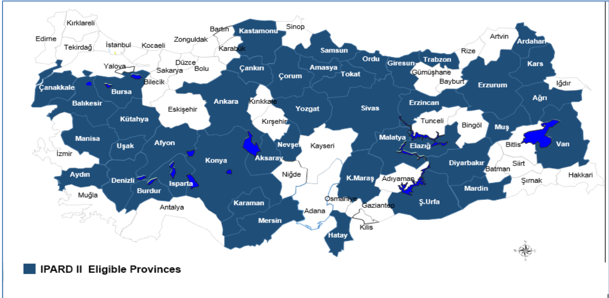
Şekil 1. Programın Başlaması ile Birlikte IPARD 2014-2020'den Yararlanacak Olan İller

2007-2013 programından sorunsuz bir geçiş sağlamak amacıyla 2014-2020 programı ilk başta IBBS Düzey 3 bölgelerine karşılık gelen ve IPARD 2007-2013'ün uygulandığı 42 ili (Afyonkarahisar, Ağrı, Aksaray, Amasya, Ankara, Ardahan, Aydın, Balıkesir, Burdur, Bursa, Çanakkale, Çankırı, Çorum, Denizli, Diyarbakır, Elazığ, Erzincan, Erzurum, Giresun, Hatay, Isparta, Kahramanmaraş, Karaman, Kars, Kastamonu, Konya, Kütahya, Malatya, Manisa, Mardin, Mersin, Muş, Nevşehir, Ordu, Samsun, Sivas, Şanlıurfa, Tokat, Trabzon, Uşak, Van ve Yozgat ) kapsayacaktır. Ulusal Kırsal Kalkınma Stratejisi, IPARD Programı'nın 81 ilin tamamının katılımını öngördüğünden, eldeki bütçe, fon emilim eğilimleri ve maliyet/kâr analizi ile yönetim maliyetleri göz önünde bulundurularak IPARD 2014-2020 program kapsamının tüm illere genişletilmesi gündeme gelebilir. Karar alınırken ayrıca, AB Kırsal Kalkınma deneyiminin tüm ülke genelinde genişletilmesi ile ortaya çıkan katma değer de hesaba katılacaktır.